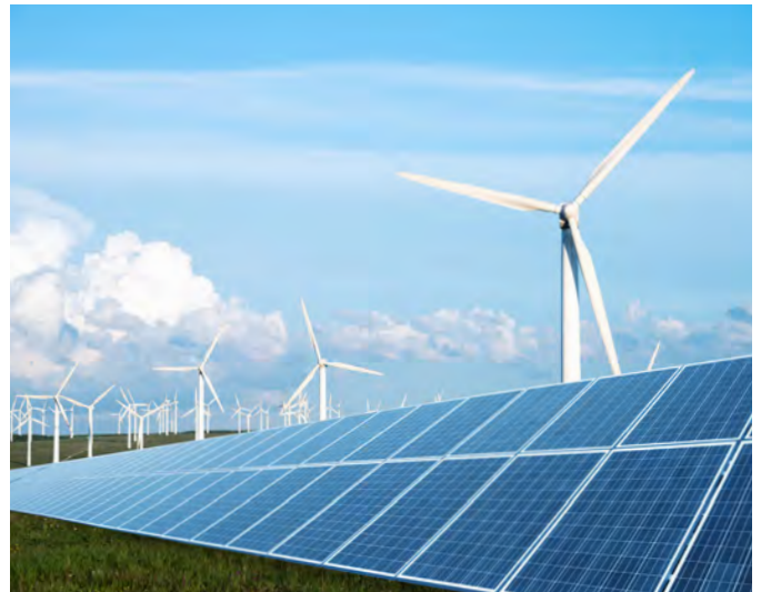
Energía Verde, Infraestructuras Industriales