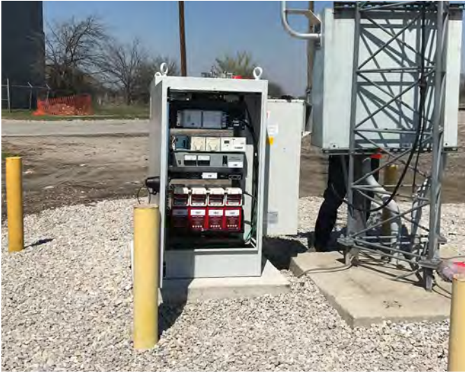
5G, Edge, IoT

La tecnología está en todas partes, y cuando necesite almacenar y proteger equipos electrónicos o de TIC valiosos que tendrán que permanecer en entornos sucios y húmedos, confíe en las soluciones de Contenedores Industriales RMR® de CPI.