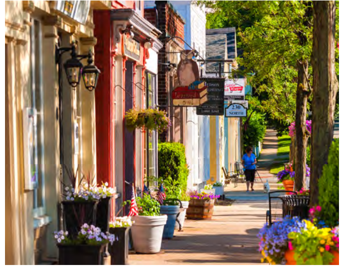
Centros Comerciales y Residenciales