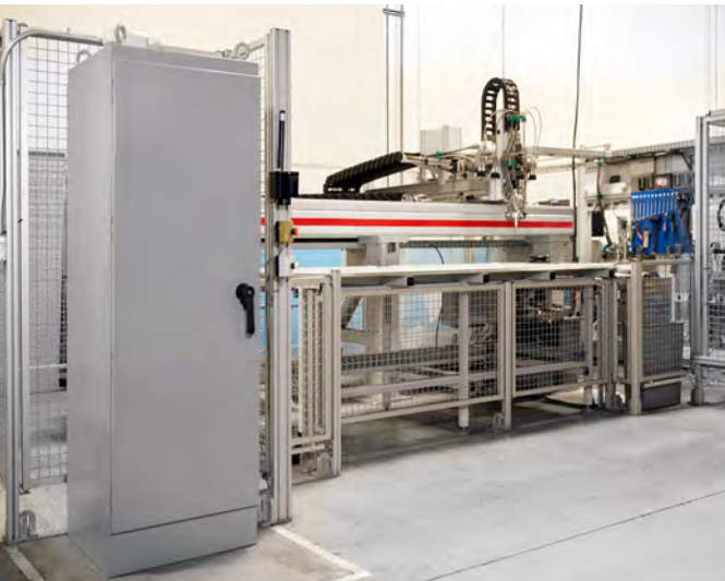
Plantas de Fabricación, Almacenes