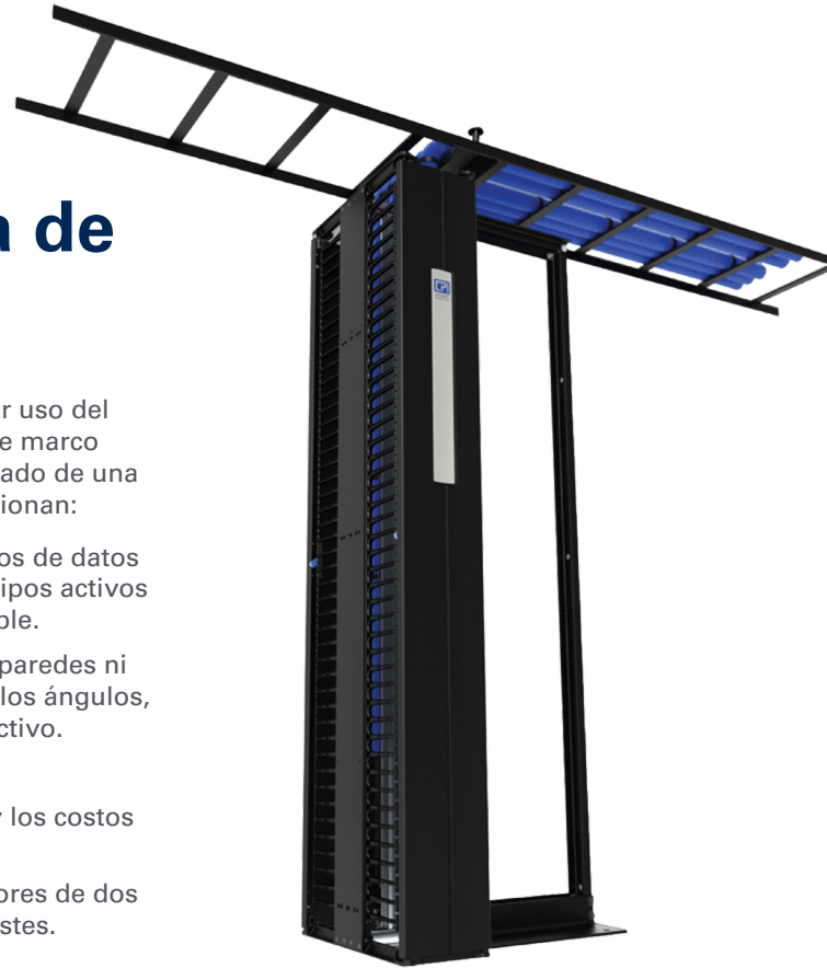
Bastidor Universal de Dos Postes

Definir las dos opciones es bastante sencillo. Los bastidores de dos postes se suelen usar con bastidores abiertos de montaje en piso para paneles de conexiones y contenedores de fibra con equipos de montaje en bastidor de menos de 20" (510 mm) de profundidad, mientras que los bastidores de cuatro postes son una opción más inteligente para equipos más grandes y pesados, como switches de red, porque rodean los equipos y brindan soporte delantero y trasero. Por lo general, tomar la decisión correcta depende de sus necesidades de equipo actuales y futuras.