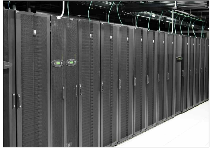
定制 GF 系列 GlobalFrame 机柜的结合为帮助 Cologix, Inc. 实施 CPI 热通道封闭系统 (HAC) 解决方案提供了支柱。

在规划任何数据中心的设计时，Cologix 必须根据每个场地的独特属性加以调整，包括设施布局、冷却低效以及产品的成本和品质。