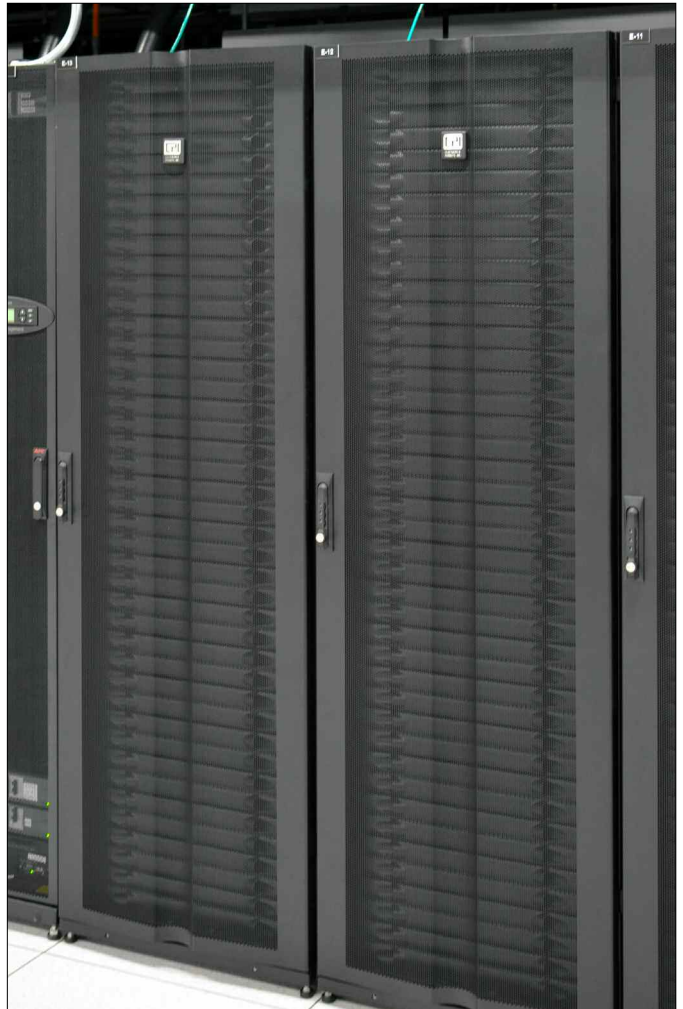
为改善 Cologix 达拉斯数据中心气流效率，安装了 CPI 的 GF 系列 GlobalFrame 机柜，其包含定制门、支撑挡板和 HotLok® 快速拆卸式盲板。