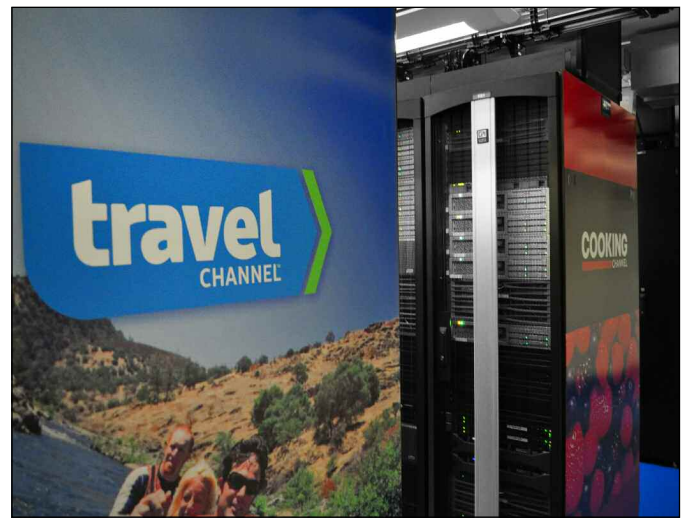
Scripps Networks 的数据中心成为一件展示品。