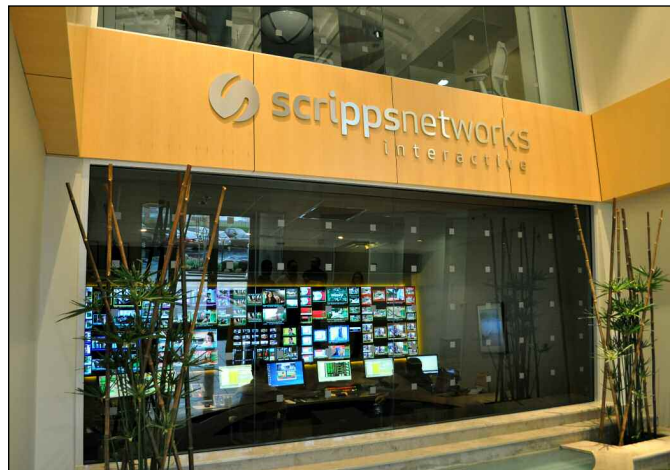
Scripps Networks Interactive 的总部位于田纳西州的诺克斯维尔，在这里，他们为其世界各地的生活时尚品牌管理着数据中心的运营。

Evolution 满足高密度布线要求并整理缆线，以便在执行移动、添加和更改时从头至尾轻松地对缆线进行跟踪，从而节省宝贵的时间和金钱。