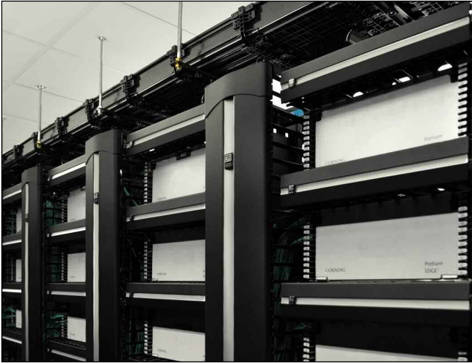
CPI 的双立柱标准机架和 Evolution 缆线管理可管理 Scripps Networks 的光纤交叉连接处。

White 表示：“Scripps 是实施此类设置的首家公司，该设置现在已是最新 CPI TeraFrame 机柜的标准功能”。毛刷式开口可通过将排出的空气封闭在机柜内，来帮助提高数据中心的效率。